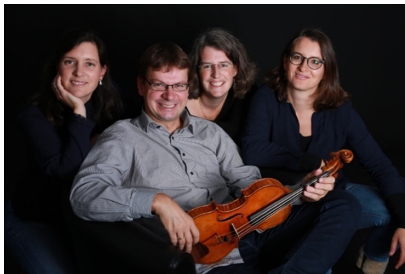
SONOS Quartett