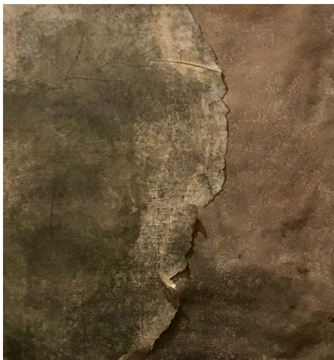
Cabalus, Vézelay